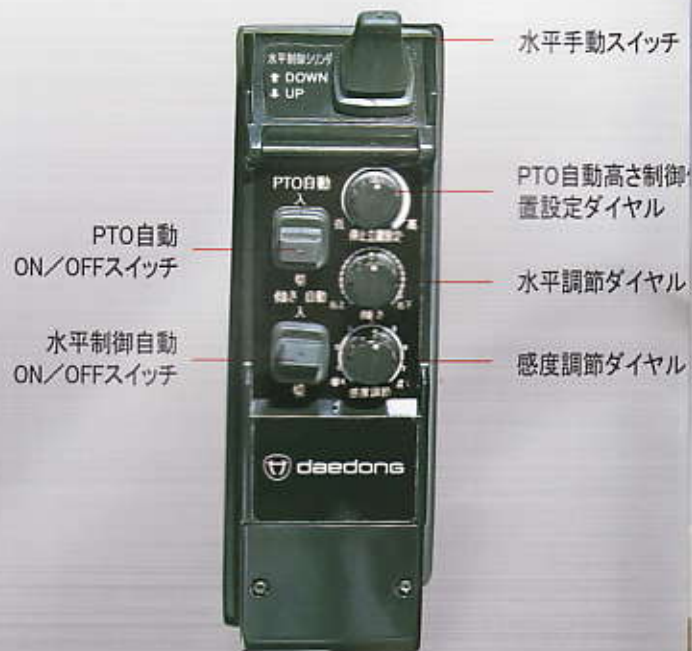
水平制御未装着時